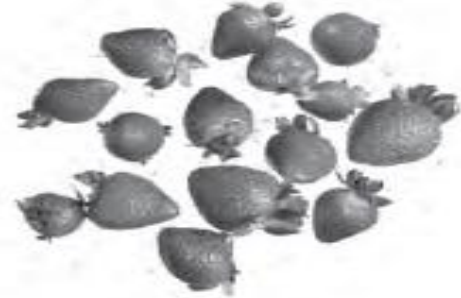
There are _____ strawberries.