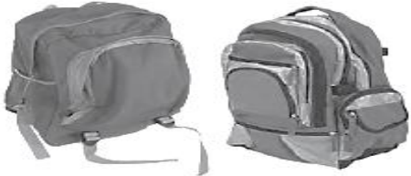
pencil cases / school bags