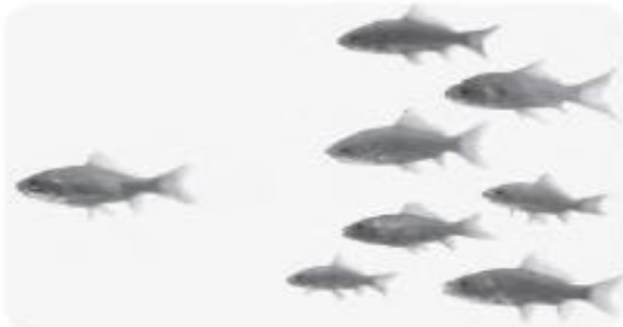
There are _____ fish.