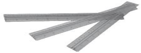
rubbers / rulers