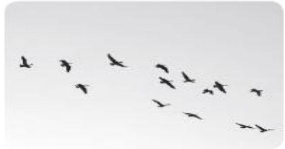
There are _____ birds.