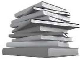
books / pens