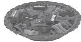
pencils / sharpeners