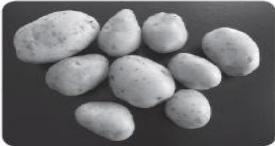
There are _____ potatoes.