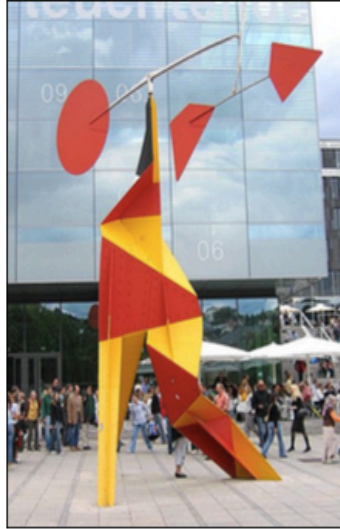
Rizado con disco rojo de Alexander Calder