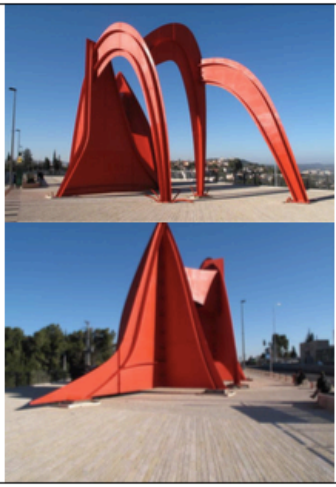
Estable en Modeme Kunst de Alexander Calder