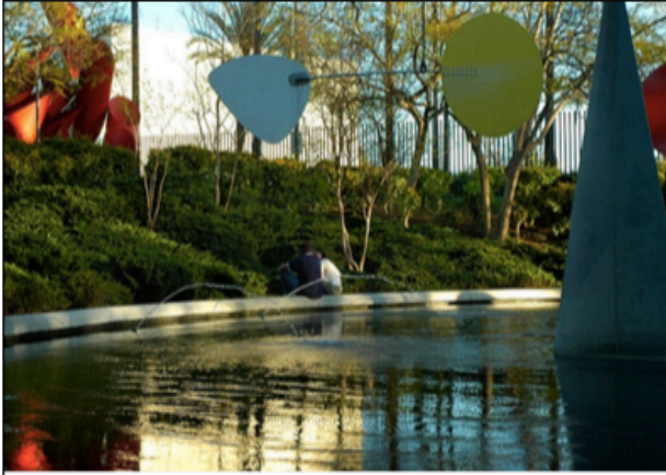
Móvil acústico en el Museo de Escultura LACM de Alexander Calder