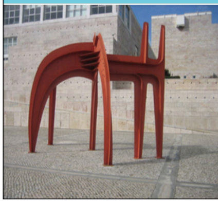
Centro Cultural Belém de Alexander Calder