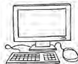
computer / cupboard

2. Encierra en un círculo o destaca la preposición correcta de acuerdo con la imagen (1pto c/u)