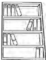
bookbag / bookcase